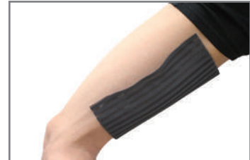
太もも裏・肉離れなど