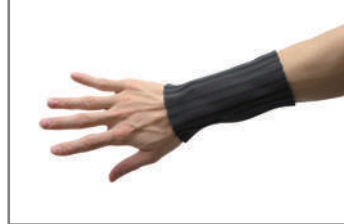
前腕部・腱鞘炎など